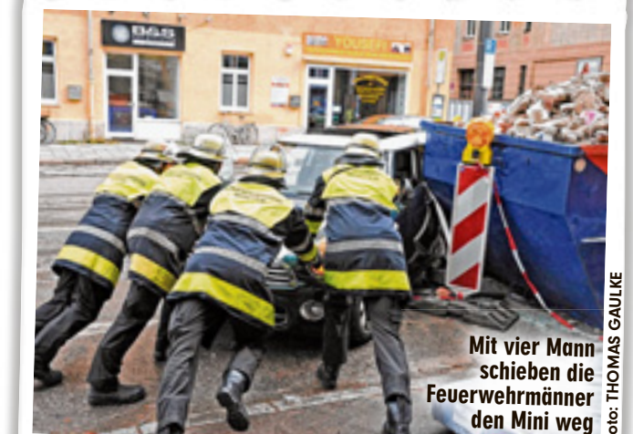
Mit vier Mann schieben die Feuerwehrmänner den Mini weg

München - Was für ein Irrer! Ein psychisch kranker Mann (39) hat am Freitag am S-Bahnsteig Donnersbergerbrücke einen Rentner (72) in die Gleise geschubst. Zum Glück kam kein Zug. Der Mann war verwirrt, schimpfte auf dem Bahnsteig laut vor sich hin. „Ihr Schweine!“ und „Ich bringe dich um“ brüllte er. Den Münchner Rentner schubste er ins Gleisbett. Der Senior blieb bewusstlos liegen, wurde von Passanten in Sicherheit gebracht. Nur leichte Verletzungen. Der Täter wurde gefasst. Unterbringung im Bezirksklinikum!