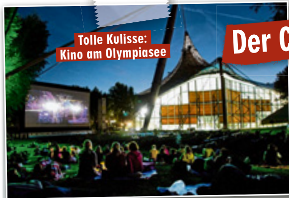
Tolle Kulisse: Kino am Olympiasee

IHR KONTAKT ZUR REDAKTION Telefon (089) 21 10 32 77 Telefax (089) 21 10 32 72 E-Mail mucred@bild.de Abo-Hotline* 01806/52 56 36 *13,20 €/Anruf aus dem dt. Festnetz, Mobilfunk max. 0,60 €/Anruf