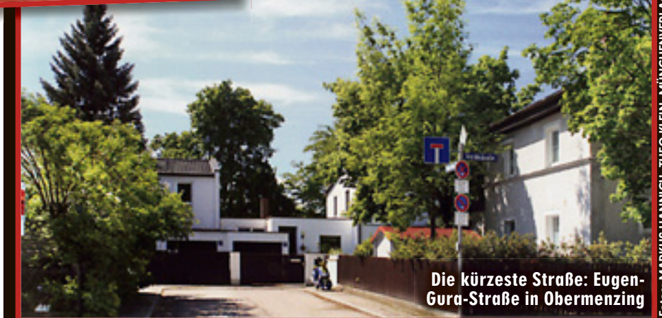
Die kürzeste Straße: Eugengura-Straße in Obermenzing

Der Tatort: Ein schicker Altbau in der Mauerkircherstraße