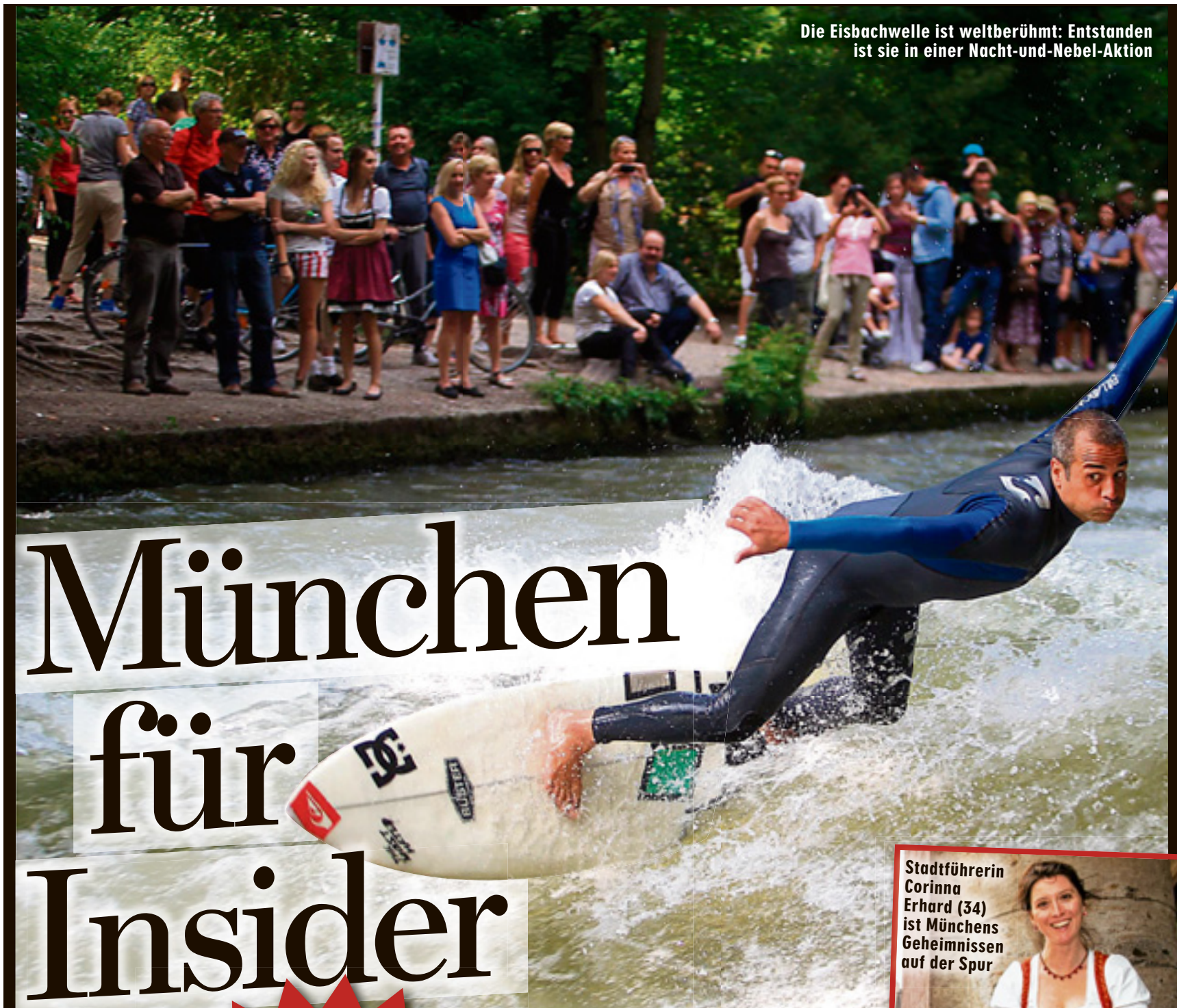
Die Eisbachwelle ist weltberühmt: Entstanden ist sie in einer Nacht-und-Nebel-Aktion